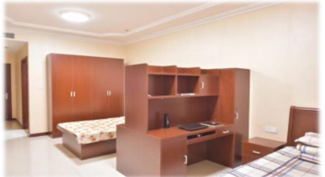
上图：食宿环境（商务区及项目公司）