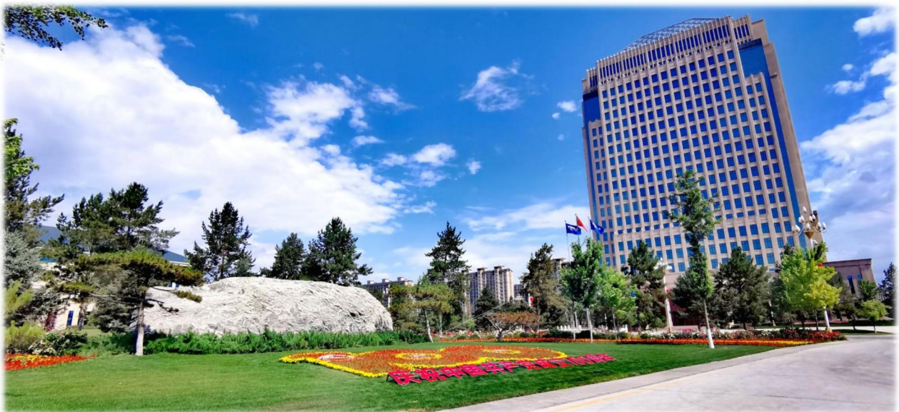
上图：特变电工商务区总部